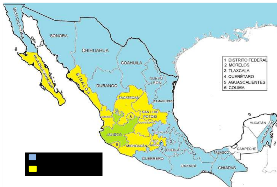
Imagen 1. Inscripción a centros Temáticos y Regionales

Mientras que Baja California Sur, Sinaloa, Zacatecas y San Luis Potosí se distribuyen entre temáticos y varios regionales. Es importante señalar que en estos estados es fuerte la presencia de las asociaciones de egresados de la Universidad de Guadalajara quienes sirven de puente entre los aspirantes y la universidad apoyándolos con los trámites de primer ingreso. Los aspirantes del resto de los estados se inscriben sólo en temáticos.